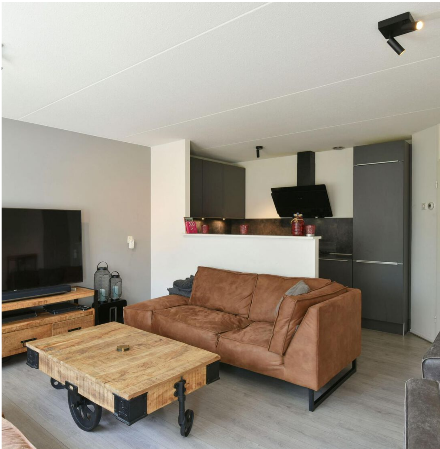
Zicht op de open keuken