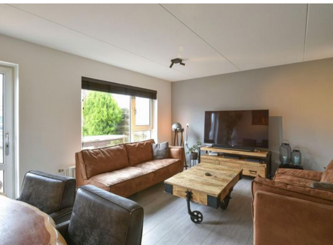
Woonkamer met open keuken