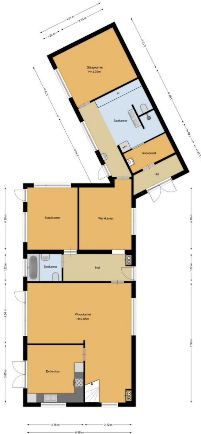
't Paadje 18, Laren Begane grond

De plattegronden zijn geproduceerd voor promotionele doeleinden en ter indicatie. Aan de plattegronden kunnen geen rechten worden ontleend.